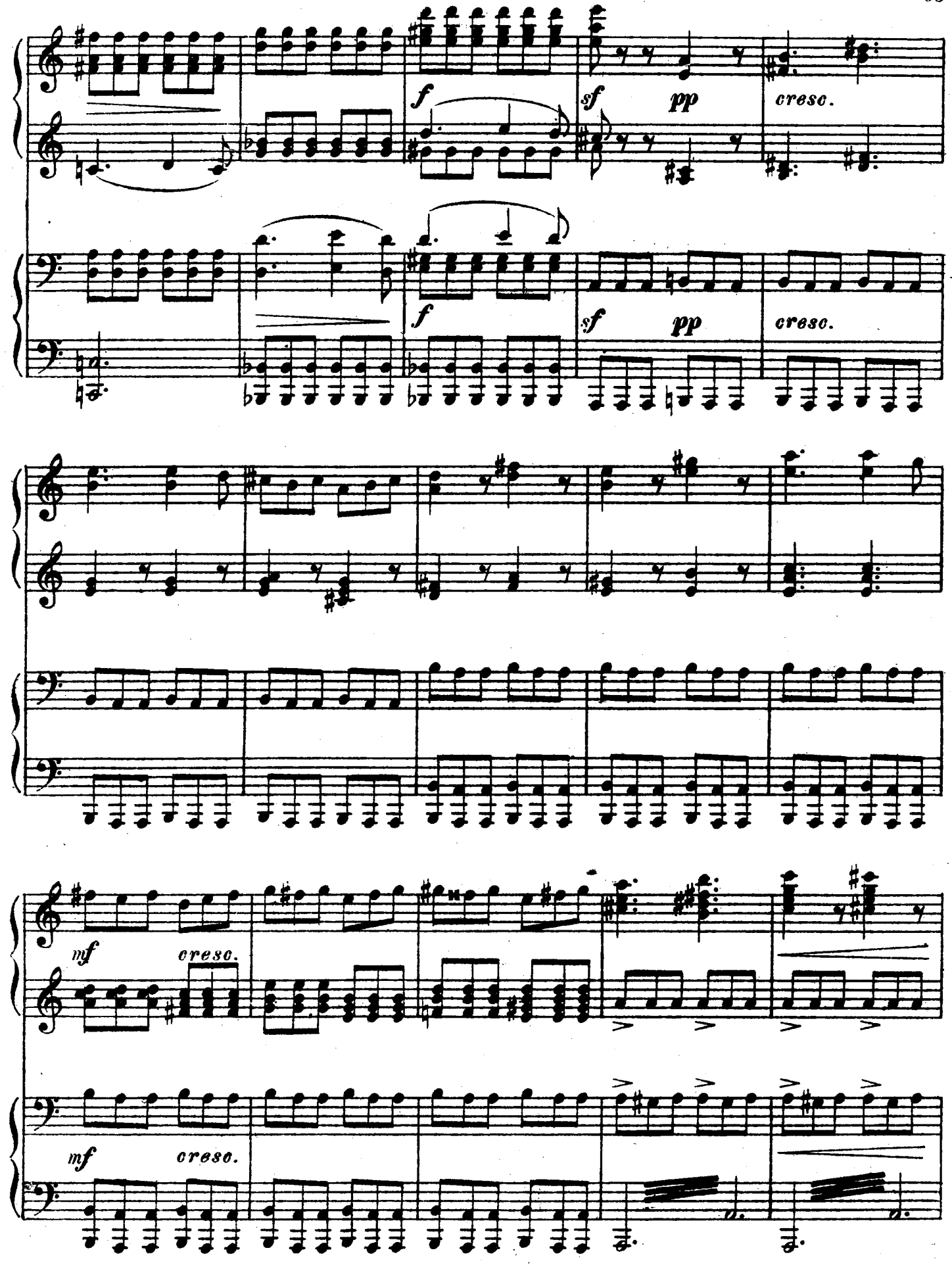
M. 16612 P