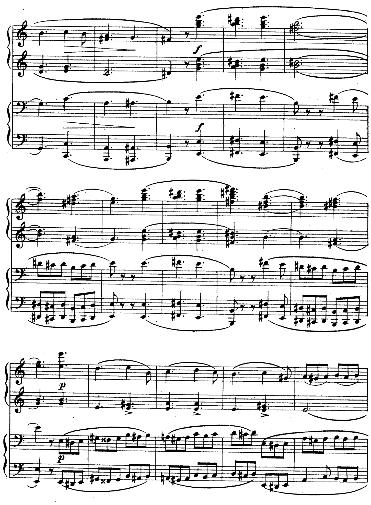
м. 18612 г.