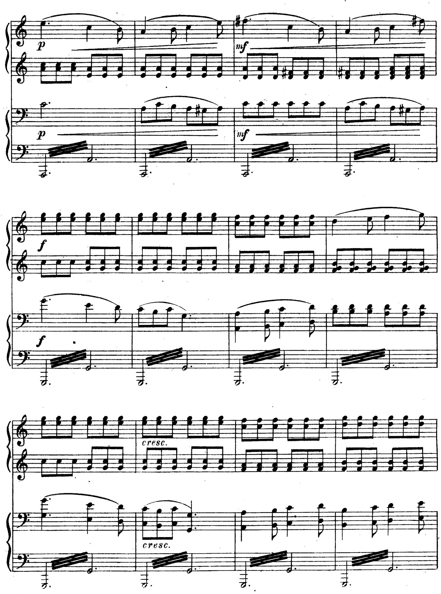
м. 16612 г.