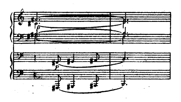
м. 16612 г.

1) В афтографе № 404 далее следуют 2 такта, зачеркнутые чериндами: Dans l'autographe № 404 les deux mesures qui suivent sont barrées à l'encre: